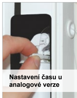
Nastavení času u analogové verze