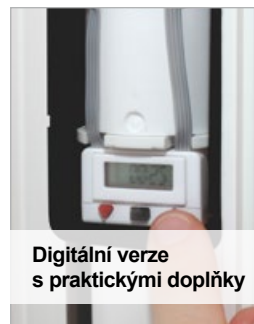
Digitální verze s praktickými doplňky