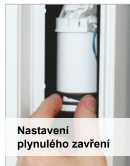
Nastavení plynulého zavření