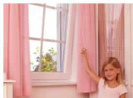
Jednoduché větrání s větší bezpečností