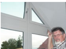
Perfektní řešení také pro střešní okna