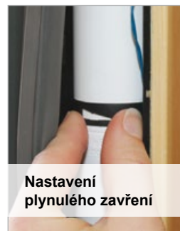
Nastavení plynulého zavření