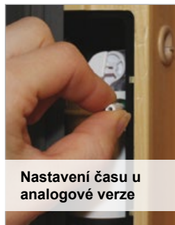
Nastavení času u analogové verze