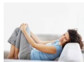
Pohodlí a úspora času pro všechny

Jednoduše geniální »» Čerstvý vzduch jedním tahem