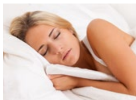
Spaní na čerstvém vzduchu i přes hluk