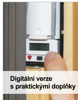
Digitální verze s praktickými doplňky