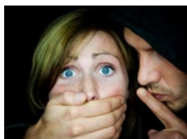
Minimalizace rizika vloupání, přídržná síla 300 kg