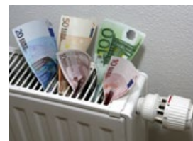
Enormní snížení nákladů na vytápění